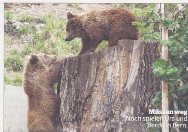
Müssen weg Noch spielen Urs und Berta in Bern.